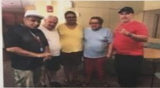
El Comité de Campaña de Buena Salud Bucal