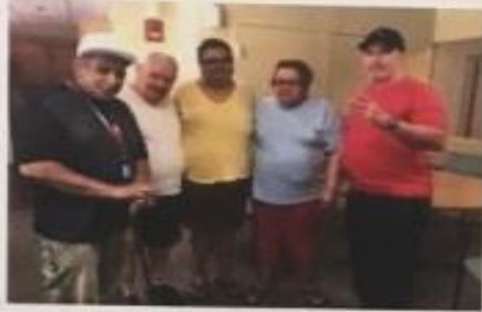
The Good Oral Health Campaign Committee