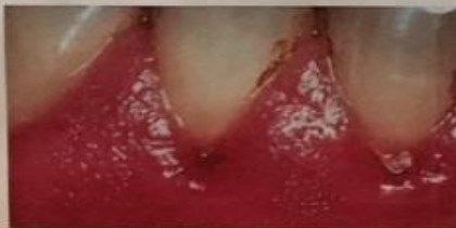
Gum Disease / Enfermedad de las encías