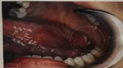
Oral Cancer / Cáncer Oral