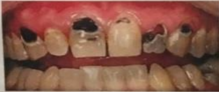
Tooth Decay/ Caries