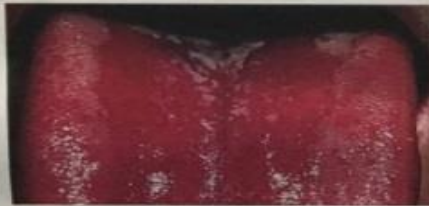
Thrush / Candidiasis