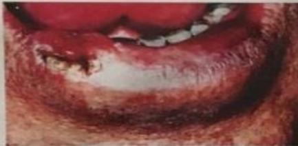
Oral Cancer / Cáncer Oral